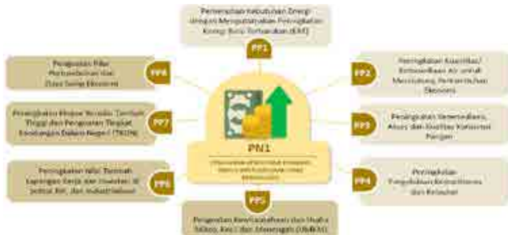
Gambar 3.1 Prioritas Nasional (PN1) dan Program Prioritasnya (PP)

Berdasarkan Gambar 3.1, Program Prioritas (PP) yang menjadi kontribusi penting Kementerian Pertanian, yaitu Peningkatan Ketersediaan, Akses dan Kualitas Konsumsi Pangan (PP3) dan Peningkatan Nilai Tambah, Lapangan Kerja, dan Investasi di Sektor Riil dan Industrialisasi (PP6). Ditjen PKH akan berkontribusi terhadap Prioritas Nasional 1 (PN 1) dengan Program Prioritas 3 (PP3) dan Program Prioritas 6 (PP6)