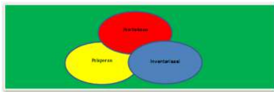
Gambar 1. Proses Penatausahaan Barang Milik Negara

Penatausahaan Barang Milik Negara bertujuan untuk mewujudkan tertib administrasi dan mendukung tertib pengelolaan Barang Milik Negara yang meliputi penatausahaan pada Kuasa Pengguna Barang/Pengguna Barang serta Pengelola Barang sebagaimana diatur dalam Peraturan Menteri Keuangan Nomor: 181/PMK.06/2016 tentang Penatausahaan Barang Milik Negara.